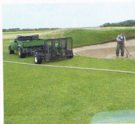
So schwer hatten es die Greenkeeper.