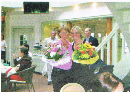
Tolle Stimmung beim Preis des Pro's.

Nach einem Tag der regenbedingten Zwangspause fieberten dann schon wieder alle am Start um den Preis der Gemeinde