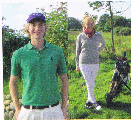
Die Brutto-Sieger beim Preis der Ehrenmitglieder (22. Sylter Golfstage).

Beide Senioren-Mannschaften werden jeweils als Gruppensieger aufsteigen, Senioren II in Gruppe D und Senioren I in Gruppe C (mit 120 Schlägen Vorsprung vor dem Gruppenzweiten). Das Damen-Team hat mit einem 2. Platz in Gruppe B den angestrebten Klassenerhalt ungefährdet bestätigt. Die Jungseniorenmannschaft liegt an zweiter Stelle mit deutlichem Vorsprung vor Aukrug, muss aber noch ein Spiel am 10. September in Kitzberg bestreiten, um dann sicherlich auch ihren Klassenerhalt in A zu bestätigen.